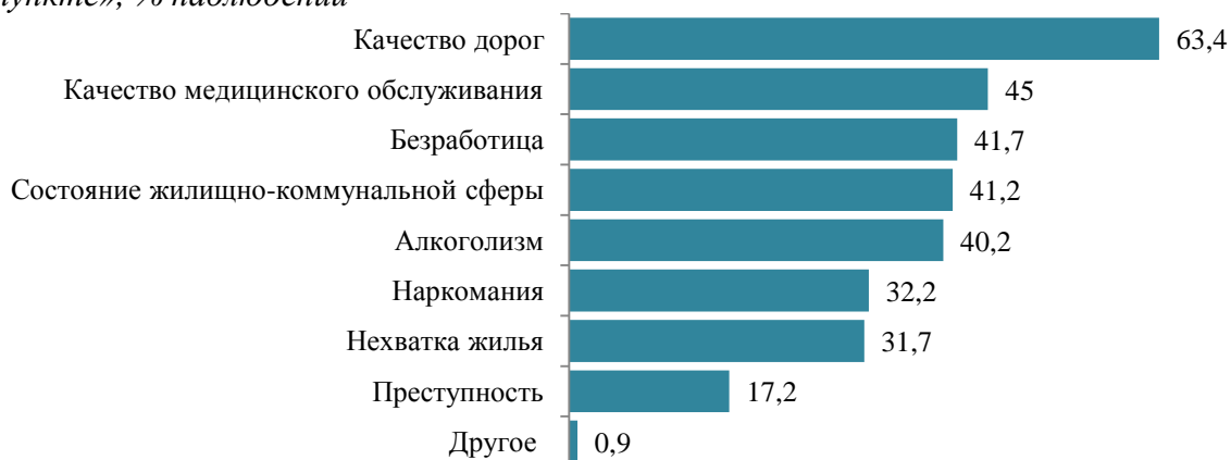
Рис. 1. Распределение ответов респондентов на вопрос: «Укажите, пожалуйста, 5 наиболее острых проблем, требующих решения в первую очередь в Вашем населенном пункте», % наблюдений 3

В структуре социальных проблем населения муниципальных образований Приморского края проблема немедицинского употребления наркотических веществ располагается в числе наименее или менее важных проблем (табл.2). Стоит отметить наиболее острые проблемы в каждом рассмотренном муниципальном образовании: